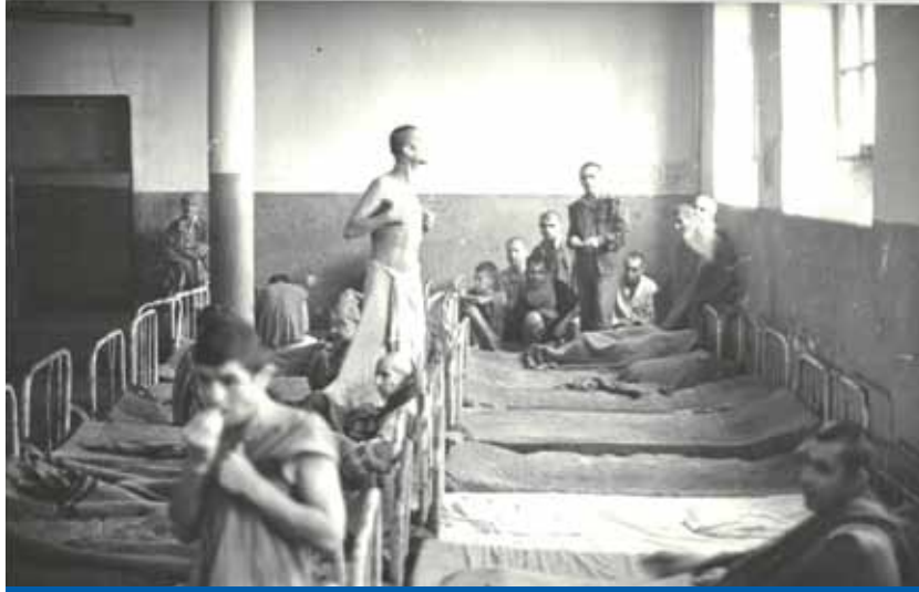
Erkek Yatakhane'sinden Görünüm, 1970'li yılların sonu