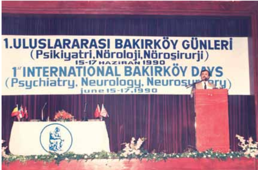
1. Uluslararası Bakırköy Günleri, 1990