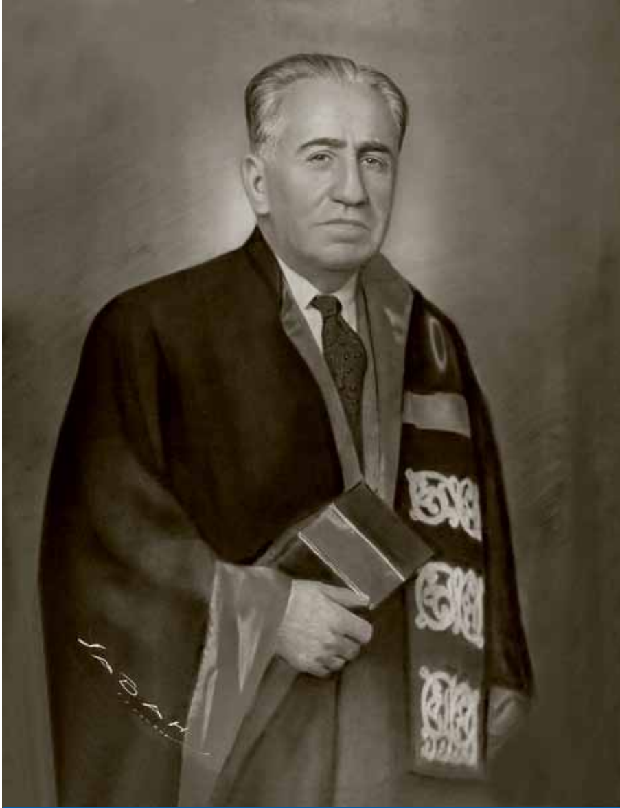
Hastanenin kurucusu ve ilk başhekimisi Ord. Prof. Dr. Mazhar Osman, Türk psikiyatrisinin gelişmesinde en büyük katkısı olan, halk arasında efsaneleşmiş hekimimizdir.

Hastane, İstanbul Emraz-ı Akliye ve Asabiye Hastanesi adıyla Reşadiye Kışlası arazisinde hizmet vermeye başlamıştır. Başhekim Dr. Mazhar Osman, Toptaşı'nın Bakırköy'e taşınması için Dr. Fahrettin Kerim'i [Gökay] görevlendirmiş, 1924 yılında onarılan binaların bir kısmına 38 kişilik ilk hasta grubu yerleştirilmiştir. Hastaların nakledilmesi aşamalı olarak sürmüştü ve 1927 yılında Toptaşı Bimarhânesi kapatılarak tüm hastalar Bakırköy'de tedavi edilmeye başlanmıştır.