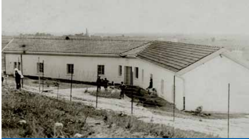
1920'li yıllar-Hastane servisi

Bu yıllarda ulaşım ve tedavi imkânlarının yetersizliği nedeniyle hastaların yatış süreleri oldukça uzundur. Hastaların büyük bir kısmı memleketlerine yollanamadığından uzun süre hastanede kalmıştır. 3000 kişilik olarak kurulan hastanenin hasta sayısı bir ara 5000'e kadar yükselmiştir.