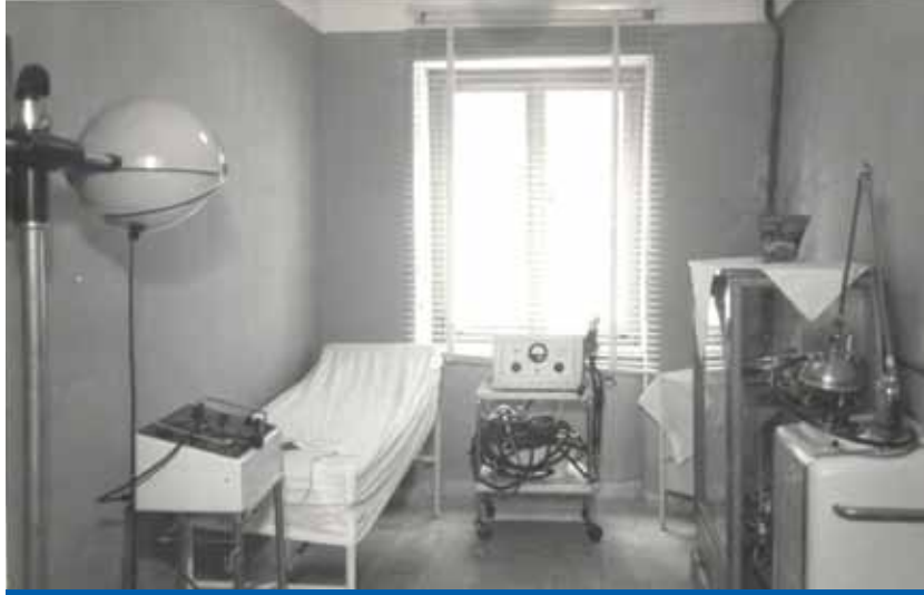
Hastane Servisinden bir görüntü, 1960'lı yıllar