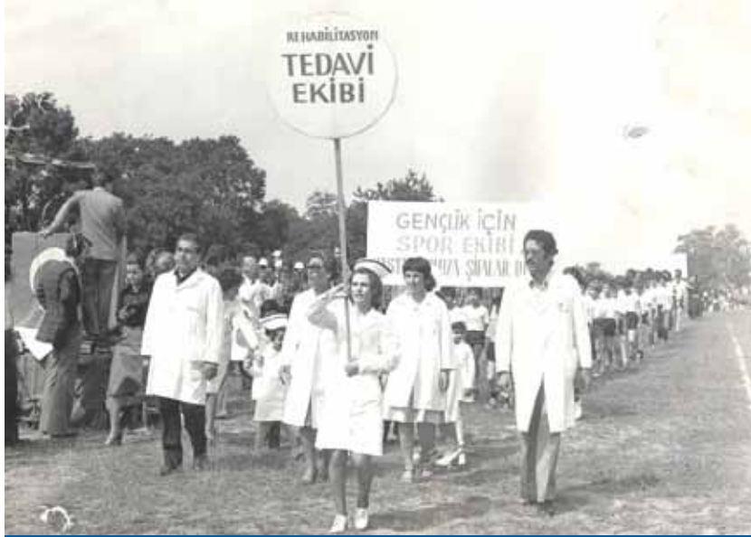
1960'lı yıllar-Geleneksel Bahar Şenliklerinden görünüm